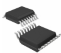
ADM3202ARU-REEL7 Analog Devices Inc. IC TXRX DUAL RS-232 3.3 16TSSOP