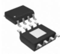
MIC69301-1.2YME-TR Microchip Technology IC REG LDO 1.2V 3A 8SOIC