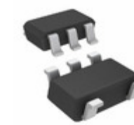
TSC101CIYLT STMicroelectronics IC OPAMP CUR SENS 450KHZ SOT23-5