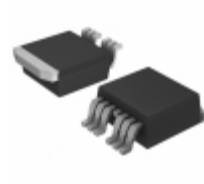
IXTA182N055T7 IXYS MOSFET N-CH 55V 182A TO-263-7