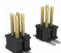
FTSH-115-01-L-DV-TR Samtec, Inc. .050" X .050 TERMINAL STRIP