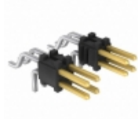
FTSH-115-01-L-MT Samtec Inc. CONN HEADER 30POS DL.05"