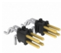
FTSH-115-01-L-MT-TR Samtec, Inc. .050" X .050 TERMINAL STRIP