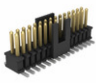
FTSH-115-01-L-DV-K-P-TR Samtec Inc. .050" X .050 TERMINAL STRIP