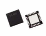
C8051F351-GM Silicon Labs IC MCU 8BIT 8KB FLASH 28MLP