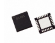
C8051F351R Silicon Labs IC MCU 8BIT 8KB FLASH 28MLP