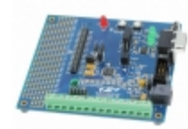
C8051F350-TB-K Energy Micro (Silicon Labs) PROTOTYPINGBOARDWITH C8051F350