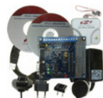
C8051F350DK Energy Micro (Silicon Labs) DEV KIT FOR F350/351/352/353