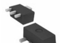
AZ432ARTR-E1 Diodes Incorporated IC VREF SHUNT ADJ SOT89-3