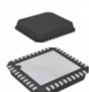
ADP3196JCPZ-RL ON Semiconductor IC CTRLR SYNC BUCK 6BIT 40LFCSP