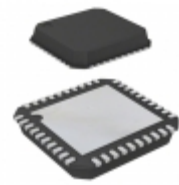
ADP3198JCPZ-RL ON Semiconductor IC BUCK CTRLR 8BIT PROG 40LFCSP