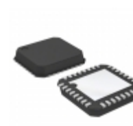
ADP3199JCPZ-RL ON Semiconductor IC CTRLR SYNC BUCK 2-3PH 32LFCSP