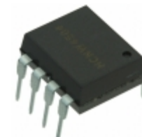
HCNW4504-000E Broadcom Limited OPTOISOLATOR 5KV TRANSISTOR 8DIP