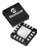
PIC16F18325T-I/JQ Microchip Technology IC MCU 8BIT 14KB FLASH 16UQFN