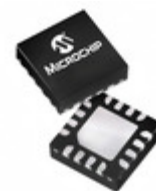
PIC16F18326-I/JQ Microchip Technology IC MCU 8BIT 28KB FLASH 16UQFN