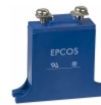
B32K275 EPCOS (TDK) VARISTOR 430V 25KA CHASSIS