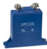
B32K460 EPCOS (TDK) VARISTOR 750V 25KA CHASSIS