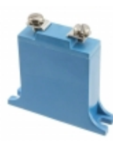
B32K385 EPCOS (TDK) VARISTOR 620V 25KA CHASSIS