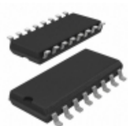
MC74LVX257MELG ON Semiconductor IC MUX QUAD 2CHAN 3ST 16-SOEIAJ