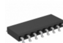
MC74LVX259D ON Semiconductor IC LATCH AADDRESS 8BIT 16-SOIC