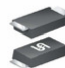
SMF78AHRVG TSC (Taiwan Semiconductor) DIODE, TVS, UNIDIRECTIONAL, 200W