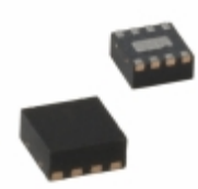
MIC47100-1.2YML-TR Microchip Technology IC REG LDO 1.2V 1A 8MLF