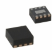
MIC47100-1.2YML-TR Microchip Technology IC REG LDO 1.2V 1A 8MLF