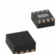
MIC47100-1.0YML-TR Microchip Technology IC REG LDO 1V 1A 8MLF