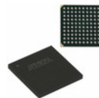
EPM7128AEFC100-7 Altera IC CPLD 128MC 7.5NS 100FBGA