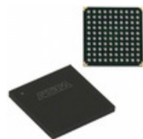
EPM7128AEFC100-5 Intel® FPGAs IC CPLD 128MC 5NS 100FBGA