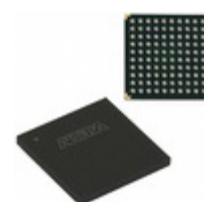
EPM7128AEFC100-5N Intel® FPGAs IC CPLD 128MC 5NS 100FBGA