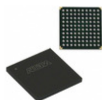
EPM7128AEFC100-5N Altera IC CPLD 128MC 5NS 100FBGA