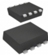
ECH8315-TL-H ON Semiconductor MOSFET P-CH 30V 7.5A ECH8