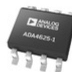
ADA4625-1ARDZ-RL ADI (Analog Devices, Inc.) SINGLE LOW NOISE, FAST SETTLING,