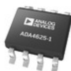
ADA4625-1ARDZ-R7 ADI (Analog Devices, Inc.) SINGLE LOW NOISE, FAST SETTLING,