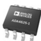
ADA4625-1ARDZ ADI (Analog Devices, Inc.) SINGLE LOW NOISE, FAST SETTLING,