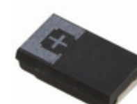
2R5TPE470MI Panasonic Electronic Components CAP TANT POLY 470UF 2.5V 2917