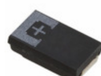
2R5TPE470MF Panasonic Electronic Components CAP TANT POLY 470UF 2.5V 2917