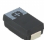
2R5TPE680MCL Panasonic Electronic Components CAP TANT POLY 680UF 2.5V 2917