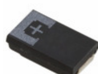
2R5TPE470M9 Panasonic Electronic Components CAP TANT POLY 470UF 2.5V 2917