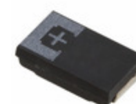
2R5TPE680MFL Panasonic Electronic Components CAP TANT POLY 680UF 2.5V 2917