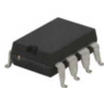
LDA210STR IXYS Integrated Circuits Division OPTOISO 3.75KV 2CH DARLNG 8SMD