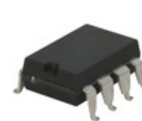
LDA210S IXYS Integrated Circuits Division OPTOISO 3.75KV 2CH DARLNG 8SMD