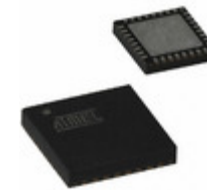
AT97SC3205T-G3M4420B Microchip Technology PROD STD COM I2C TPM 4X4 32VQFN