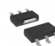
MCP1754ST-3302E/DB Microchip Technology IC REG LDO 3.3V 0.15A SOT223-3