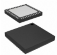
CY8C3246LTI-162 Cypress Semiconductor Corp IC MCU 8BIT 64KB FLASH 48QFN