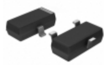
MN1382SEP Panasonic IC VOLT DETECT 2.2V CMOS SMD