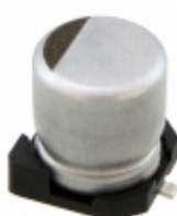
EEV106M035A9DAA KEMET CAP ALUM 10UF 20% 35V SMD