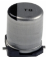
EEV-TG2A220UP Panasonic Electronic Components CAP ALUM 22UF 20% 100V SMD