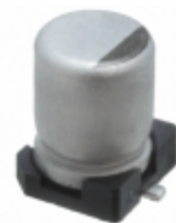
EEV106M025A9BAA KEMET CAP ALUM 10UF 20% 25V SMD