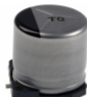
EEV-TG2A220P Panasonic Electronic Components CAP ALUM 22UF 20% 100V SMD