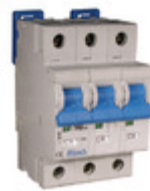
3DU10R Altech Corporation CIR BRKR THRM-MAG 10A LEVER