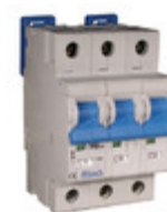
3DU20R Altech Corporation CIR BRKR THRM-MAG 20A LEVER