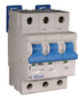
3DU15R Altech Corporation CIR BRKR THRM-MAG 15A LEVER