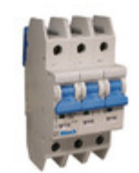
3DU15L Altech Corporation CIR BRKR THRM-MAG 15A LEVER