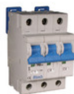
3DU40R Altech Corporation CIR BRKR THRM-MAG 40A LEVER