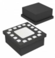
HMC874LC3CTR Analog Devices Inc. IC COMPARATOR RSPECL 16SMD