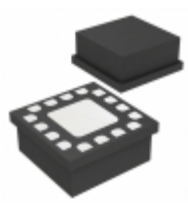
HMC876LC3C Analog Devices Inc. IC MMIC AMP GAAS PHEMT 2A 16QFN