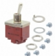
CT49001N020 APEM Inc. SWITCH TOGGLE DPDT 10A 125V