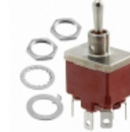
CT49021N000 APEM Inc. SWITCH TOGGLE DPDT 10A 125V