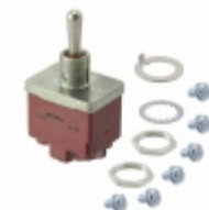
CT49001N000 APEM Inc. SWITCH TOGGLE DPDT 10A 125V