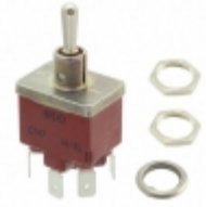
CT47031N002 APEM Inc. SWITCH TOGGLE DPDT 10A 125V