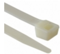
CT48NT175-L 3M 48" NATURAL 175LB CABLE TIE