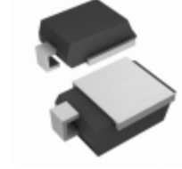
SM8S40HE3/2D Electro-Films (EFI) / Vishay TVS DIODE 40V 71.4V DO218AB