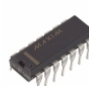
MAX1488EESD Maxim Integrated IC DVR RS232 QUAD 120KBPS 14DIP