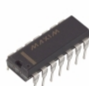
MAX1488EESD Maxim Integrated IC DVR RS232 QUAD 120KBPS 14-DIP