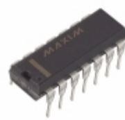
MAX1488EESD+ Maxim Integrated IC DVR RS232 QUAD 120KBPS 14-DIP