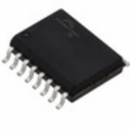
S25FL127SABMFV000 Cypress Semiconductor Corp IC FLASH 128MBIT 108MHZ 16SOIC