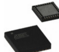
AT97SC3205T-G3M44-00 Microchip Technology PRODSTD COM I2C TPM 4X4 32VQFN