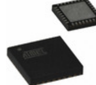
AT97SC3205T-G3M44-10 Microchip Technology PROD STD COM I2C TPM 4X4 32VQFN