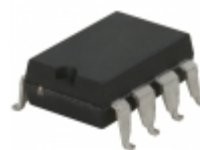
LBA127PTR IXYS Integrated Circuits Division RELAY OPTOMOS 200MA DP 8FLTPK