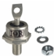
60HFU-200 Electro-Films (EFI) / Vishay DIODE GEN PURP 200V 60A DO203AB