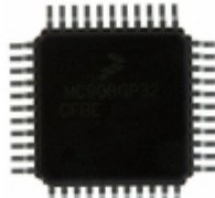
MC908GT16CFBER NXP USA Inc. IC MCU 8BIT 16KB FLASH 44QFP