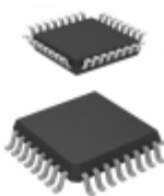
MC908GZ32MFJE NXP USA Inc. IC MCU 8BIT 32KB FLASH 32LQFP