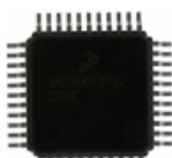
MC908GT8CFBE NXP USA Inc. IC MCU 8BIT 8KB FLASH 44QFP