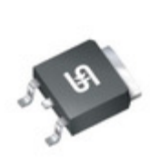
TSM3N90CP ROG TSC (Taiwan Semiconductor) MOSFET N-CH 900V 2.5A TO252