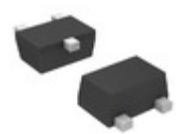
BCR 112F E6327 Infineon Technologies TRANS PREBIAS NPN 250MW TSFP-3