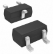
BCR 112T E6327 Infineon Technologies TRANS PREBIAS NPN 250MW SC75