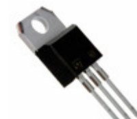
STPS10170CT STMicroelectronics DIODE ARRAY SCHOTTKY 170V TO220