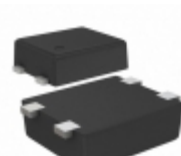
S-1000N36-I4T1G SII Semiconductor Corporation IC VOLT DETECT N-CH 36V SNT-4A