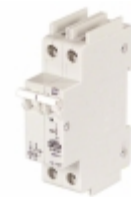
C1A2P American Electrical Inc. CIR BRKR MAG-HYDR 1A 480VAC