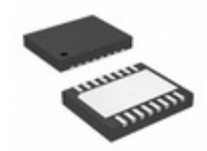
LTC1445CDHD#PBF ADI (Analog Devices, Inc.) IC COMP QD LP 1.221VREF 16- DFN