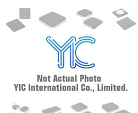
ISL6622CRZ-TS2568 INTERSIL ISL6622CRZ-TS2568 INTERSIL