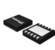
ISL6622CRZ Intersil IC MOSFET DRVR SYNC BUCK 10-DFN