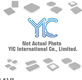
CAT24C64VI CSI CAT24C64VI CSI