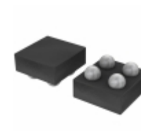
CAT24C64C4CTR AMI Semiconductor / ON Semiconductor IC EEPROM 64KBIT 400KHZ 4WLCSP