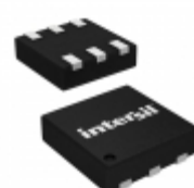
ISL9021IRURZ-T Intersil IC REG LDO 2.6V 0.25A 6UTDFN