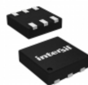
ISL9021IRUTZ-T Intersil IC REG LDO 1.9V 0.25A 6UTDFN