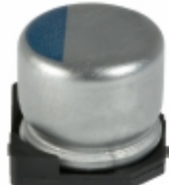
APXA200ARA220MF55G United Chemi-Con CAP ALUM POLY 22UF 20% 20V SMD