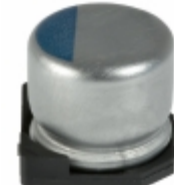
APXA160ARA390MF55G United Chemi-Con CAP ALUM POLY 39UF 20% 16V SMD