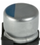
APXA200ARA220MF55S United Chemi-Con CAP ALUM POLY 22UF 20% 20V SMD