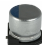
APXA160ARA390MF60G United Chemi-Con CAP ALUM POLY 39UF 20% 16V SMD