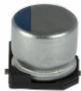
APXA200ARA220MF60G United Chemi-Con CAP ALUM POLY 22UF 20% 20V SMD