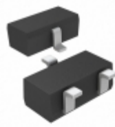
RB420DT146 Rohm Semiconductor DIODE SCHOTTKY 40V 100MA SMD3