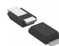
RB411VA-50TR Rohm Semiconductor DIODE SCHOTTKY 20V 500MA TUMD2