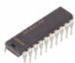
DS1211N Maxim Integrated IC CONTROLLER 8-CHIP NV 20-DIP