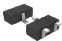
DSA300I00L Panasonic Electronic Components TRANS PNP 50V 0.1A SSSMINI3