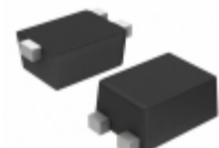
NST3906F3T5G ON Semiconductor TRANS PNP 40V 0.2A SOT-1123