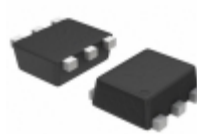
NST3946DP6T5G ON Semiconductor TRANS NPN/PNP 40V 0.2A SOT963