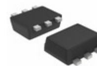
NST3906DXV6T1 ON Semiconductor TRANS 2PNP 40V 0.2A SOT563