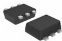
NST3946DXV6T5G ON Semiconductor TRANS NPN/PNP 40V 0.2A SOT563