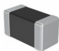
TMK042CG5R7DD-W Taiyo Yuden CAP CER 5.7PF 25V COG/NP0 01005