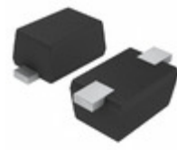
EDZVT2R27B Rohm Semiconductor DIODE ZENER 27V 150MW EMD2